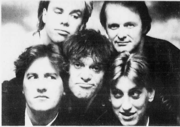
Kim Larsen omgivet af sine musikalske venner